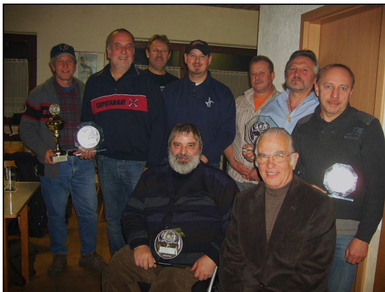
Unsere Clubmeister 2010